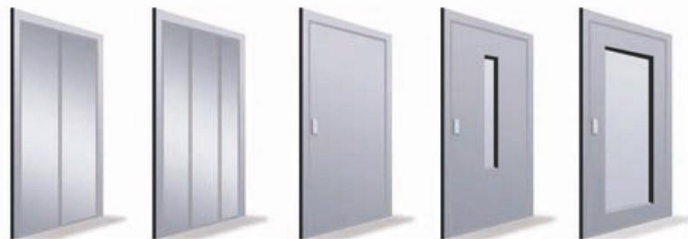
Automática de 2 hojas