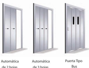
Puertas de cabina